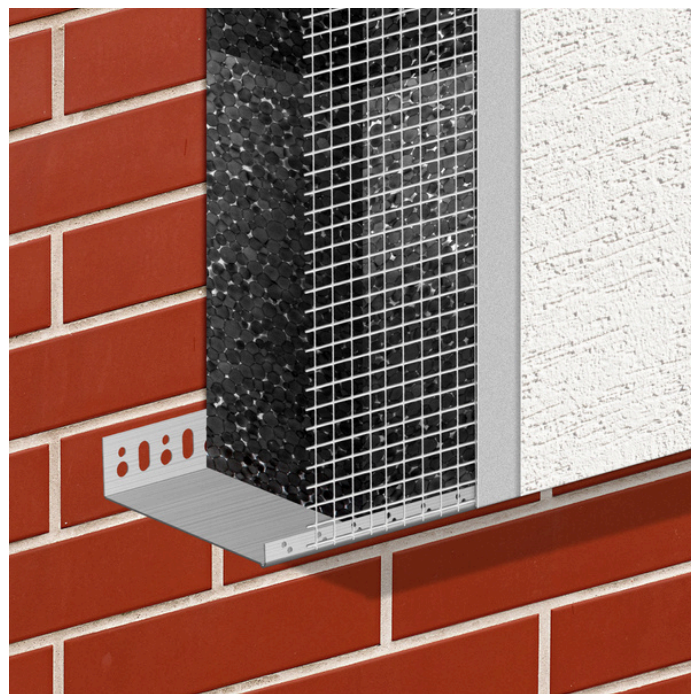
Grafika użytkowa do stosowania produktu Profil Cokołowy.